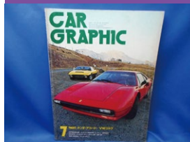
自動車関連雑誌など