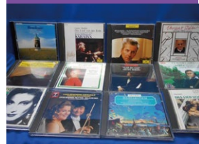
洋楽・邦楽・クラシック・ジャズなど