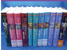
書籍全般・料理本・学術書など