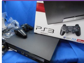
プレイステーション・Wii・DSなど