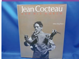
美術書・昭和初期の雑誌など