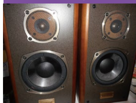
スピーカー・アンプなど